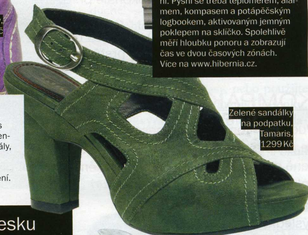
Zelené sandálky na podpatku, Tamaris, 1299 Kč

Nová kolekce značky Tamaris vnese do vašeho botníku intenzivní barvy a neotřelé materiály, které jednoznačně podtrhují mladistvý look, ale vhodně doplní i střízlivější styl oblečení. Více na www.tamaris.cz .