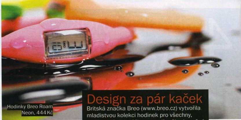
Hodinky Breo Roam Neon, 444 Kč