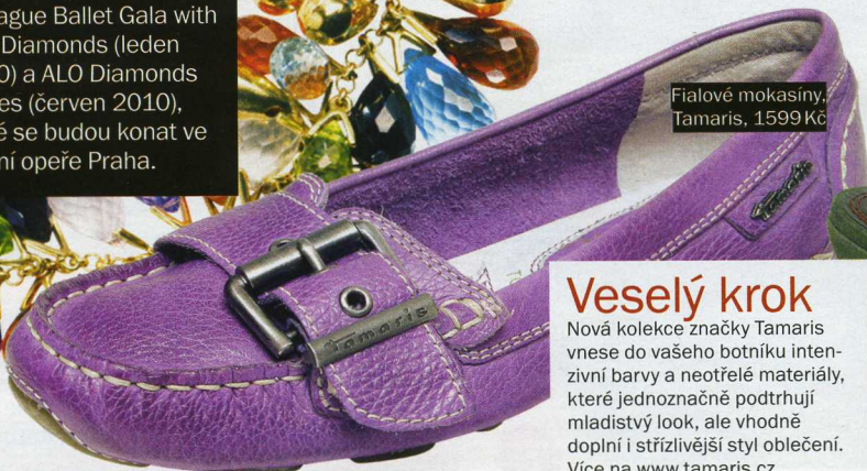
Fialové mokasiny, Tamaris, 1599 Kč

Vychytané dotykové hodinky SEA – Touch Tissot jsou naprosto geniální. Pyšní se třeba teploměrem, alarmem, kompasem a potápěčským logbookem, aktivovaným jemným poklepem na skříčko. Spolehlivě měří hloubku ponoru a zobrazují čas ve dvou časových zónách. Více na www.hibernia.cz .