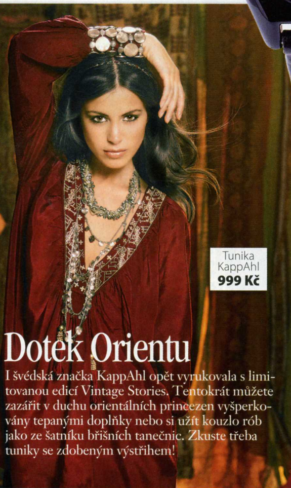
Tunika KappAhl 999 Kč