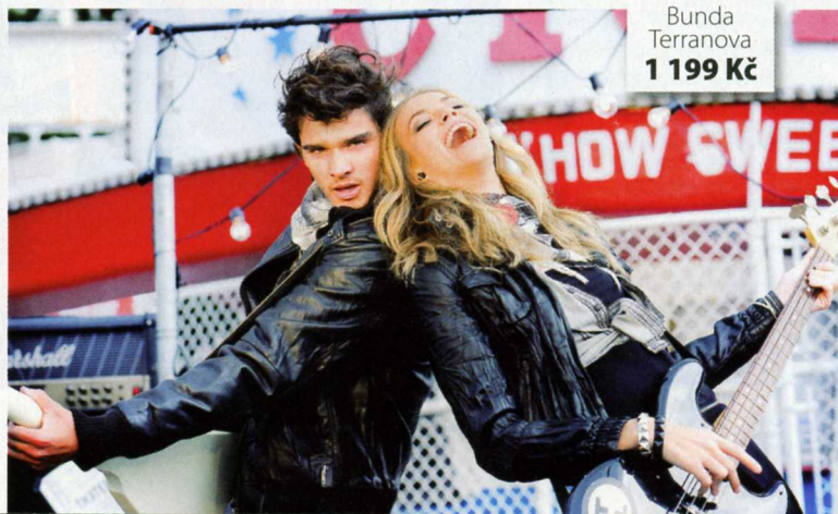
Bunda Terranova 1 199 Kč

Mladistvé modely Terranova ovládla rocková vlna! Inspirujte se hvězdami hudebního průmyslu a pořídte si krátkou koženou bundu. Nebo zkuste trička s divokým potiskem. Trocha osvěžení v potměných či uhlazených podzimních kolekcích vám jistě přijde vhod!