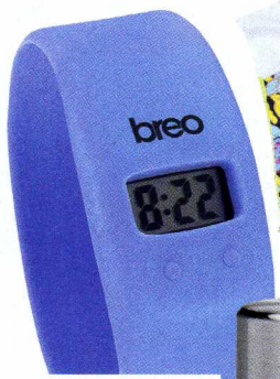
Hodinky Skin padnou jako druhá kůže a nepřekážejí. Breo, 494 Kč