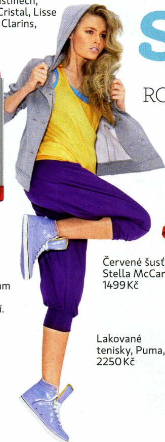
Červené šustákové šortky, Stella McCartney, Adidas, 1499 Kč

Sportovní a barevný look sluší všem ženám bez ohledu na roční období. Buďte aktivní!