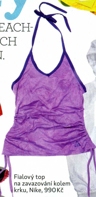
Fialový top na zavazování kolem krku, Nike, 990 Kč