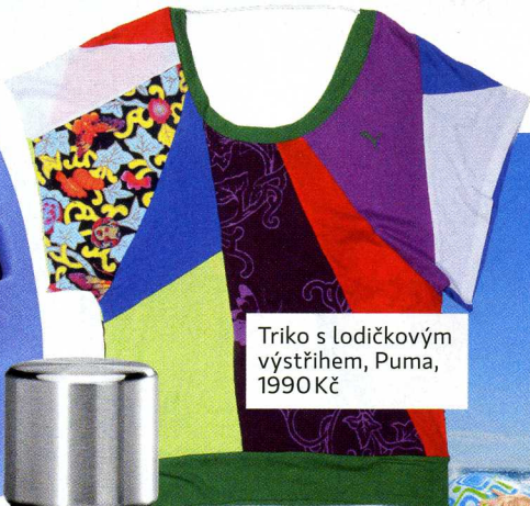
Triko s lodičkovým výstřihem, Puma, 1990 Kč