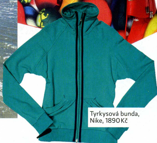
Tyrkysová bunda, Nike, 1890 Kč