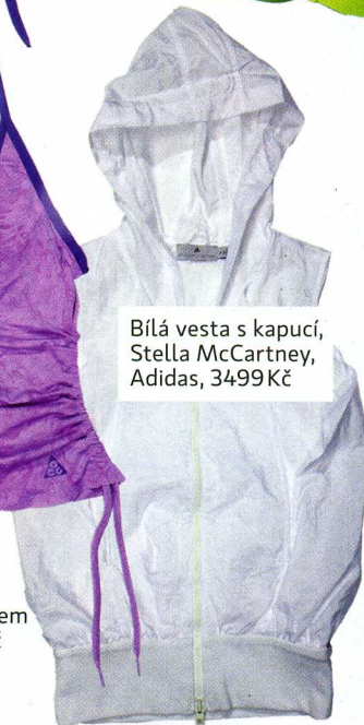
Bílá vesta s kapucí, Stella McCartney, Adidas, 3499 Kč

TEXT: LUCIE KOCHOVÁ, STYLING: IVANA PRAŽÁKOVÁ