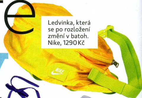
Ledvinka, která se po rozložení změní v batoh. Nike, 1290 Kč

ROZPOHYBUJTE SE NA BEACH-VOLEJBALU. V PESTRÝCH TÓNECH BUDETE IN.