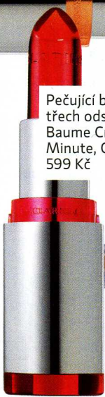
Pečující balzám ve třech odstínech, Baume Cristal, Lisse Minute, Clarins, 599 Kč