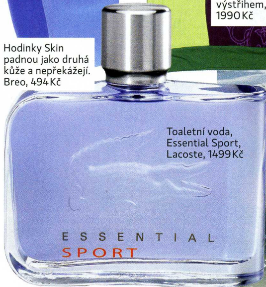
Toaletní voda, Essential Sport, Lacoste, 1499 Kč